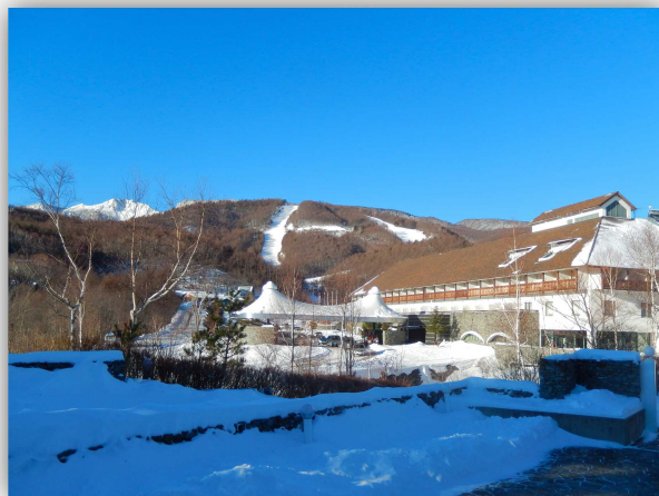
小海リエックス・スキーバレーは最長2.5kmのダウンヒルコースを持つ本格的なスキー場です。北八ヶ岳の高地、標高1,780mに位置している为上質な雪に恵まれ、ゲレンデのコンディションはいつも快適です。