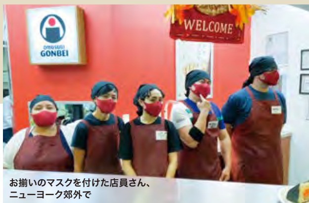
お揃いのマスクを付けた店員さん、 ニューヨーク郊外で

私達は30年以上、青少年の国際交流を進めると同時に、地球規模で物事を考えることが出来る未来のリーダーを育てるためのリーダーシップトレーニングを、主に高校生、大学生を対象に行っていました。しかしこれまでの経験から、これらの国際教育は、学校