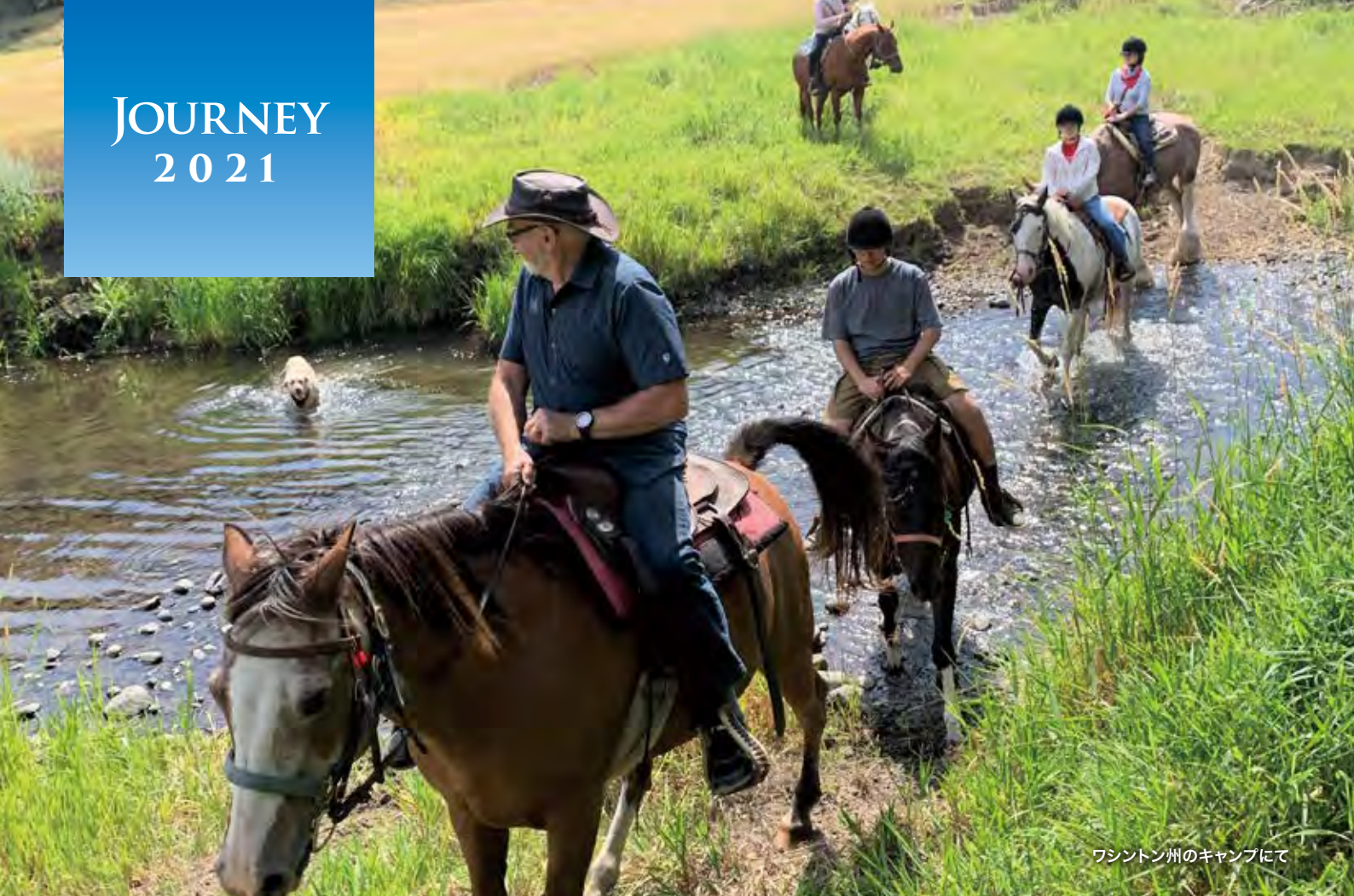
ワシントン州のキャンプにて