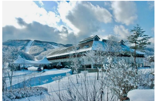
小海リエックス・スキーバレーは最長2.5kmのダウンヒルコースを持つ本格的なスキー場です。北ハケ岳の高地、標高1,780mに位置しているの上質な雪に恵まれ、ゲレンデのコンディションはいつも快適です。

参加費 小学生 89,500円 中学生以上 99,800円 初めてスキーする人 +5,000円 (マンツーマン又は少人数レッスンとなります) 交通手段 往復電車または貸切バス 集合場所 JR名古屋駅 集合時刻 午前7時40分(予定)